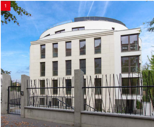
Foto: 1) Bytový dům - Praha Bubeneč, 2) Rodinný dům - Přebyslav, 3) Kostel - Praha Barandov, 4) Bytové domy - Brno Neumannova, 5) Rodinný dům - Břeží u Mikulova, 6) Student House - Praha Holešovice

V průběhu roku 2021 jsme realizovali mnoho zajímavých zakázek ať už s plastovými, dřevěnými, dřevohliníkovými nebo i hliníkovými okny. Několik jsme jich nafotili a Vám můžeme nyní ukázat některé z nich. Více fotek referencí si můžete prohlédnout na našich www stránkách v sekci reference .