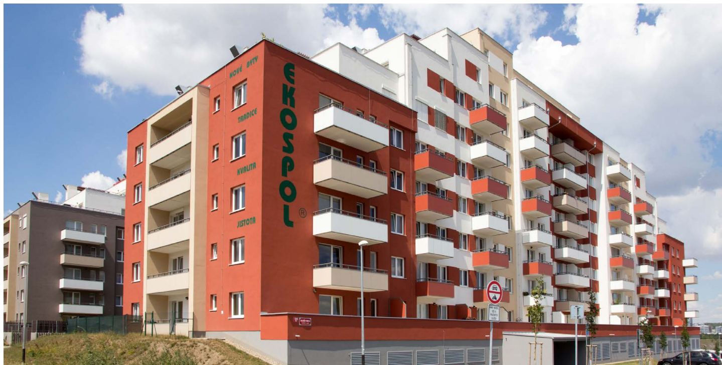
Projekt Výhledy Barrandov – realizace plastových oken od PKS okna a.s.